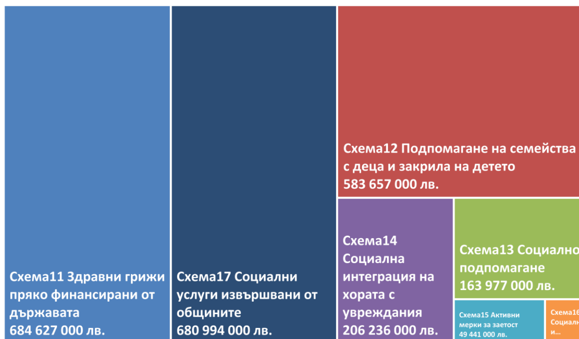
Графика 2: Разходи за социална защита в България, с изключение на социално-осигурителни фондове и плащания от работодатели (лв., 2018 г.)